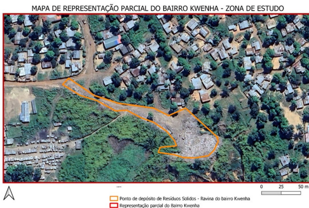
Figura1: Mapa de localização da área de estudo. Figura do autor (2023)