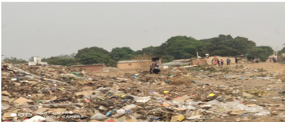
Figura 3: Imagem dos resíduos predominante na lixeira do Kwenha. Figura do autor (2023).

garrafas pet, etc...) são as que mais de destacam entre os outros, como podemos observar na figura abaixo.