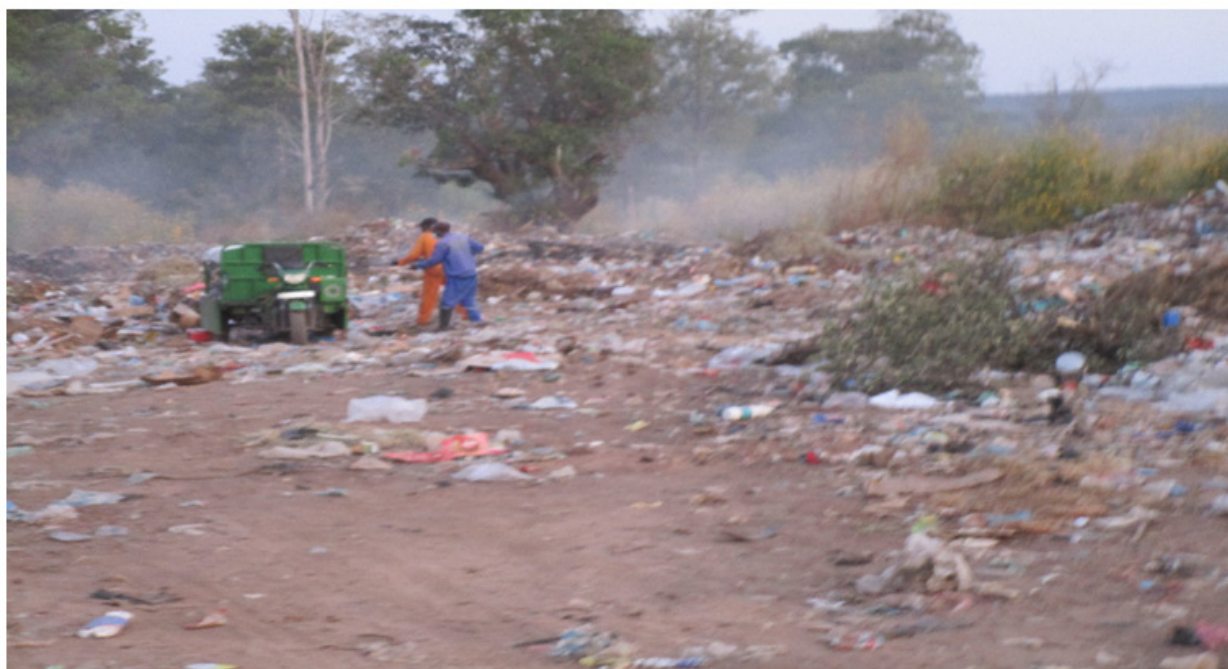
Figura 4: Imagem mostrando os operadores de recolha de resíduos sólidos urbanos, depositando o RS na lixeira do Kwenha.

G rande parte dos resíduos depositados nesta lixeira, é proveniente de vários bairros da cidade de Luena e tem nesta lixeira como a destinação final dos mesmos.