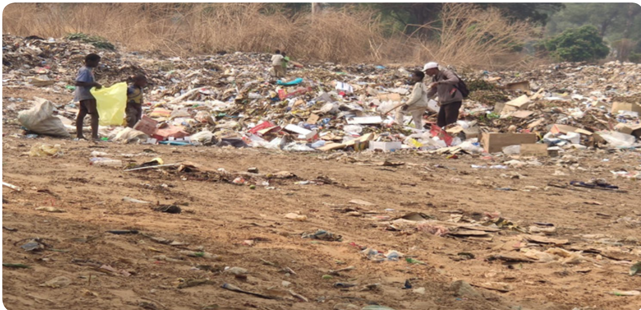
Figura 5: O lixo como fonte de renda familiar.